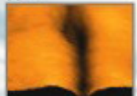
Морщины и припухлости под глазами