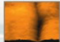
Гладкая, сияющая кожа

DermoProfessional Power Correcting Eye Patches