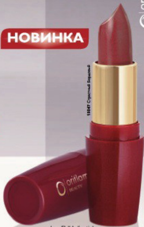
15047 Страстный Бордовый

Уже через несколько минут после нанесения ваши губы увеличивают свой естественный объем, становясь более сексуальными, более чувственными... более притягательными!