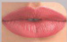
15044 Жемчужный Абрикосовый