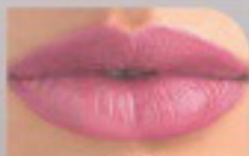
15043 Прекрасный Розовый