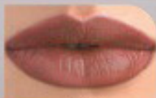
15042 Нежный Шоколадный