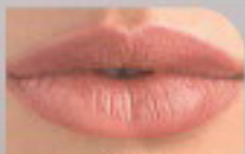
15045 Соблазнительный Красный