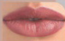
15040 Солнечный Ягодный

Маленькие модели: Пыльца – стимулятор объема естественный цвет 15067 Страстный Бордовый